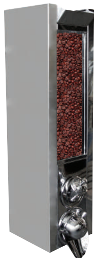
AM 120.6 BS