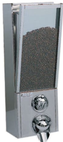
AM 120.4 BS