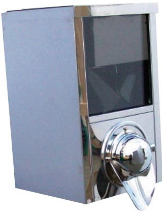
Versione B / Type B