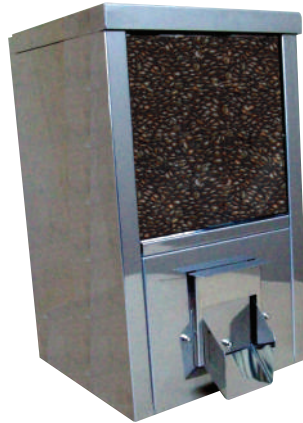
Versione S / Type S