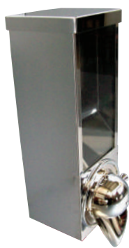
AM 50 B