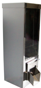
AM 50 S